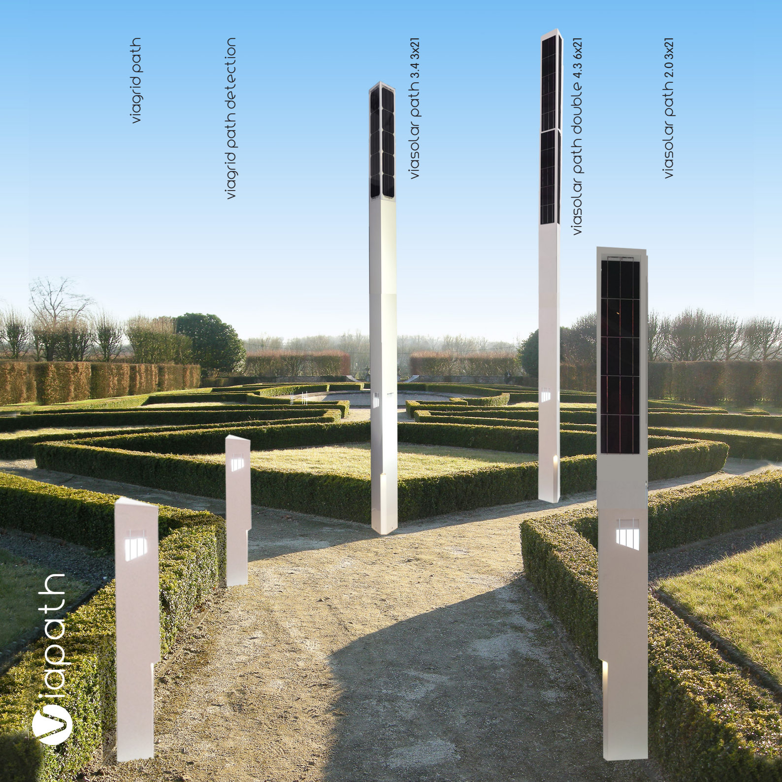
viasolar path 2.0 3x21